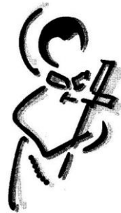
H. GERARDUS MAJELLA