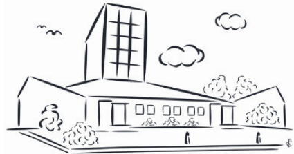
R.K. Parochie St. Jans Geboorte De Kwakel